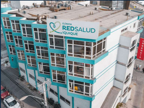
CLINICA RED SALUD IQUIQUE