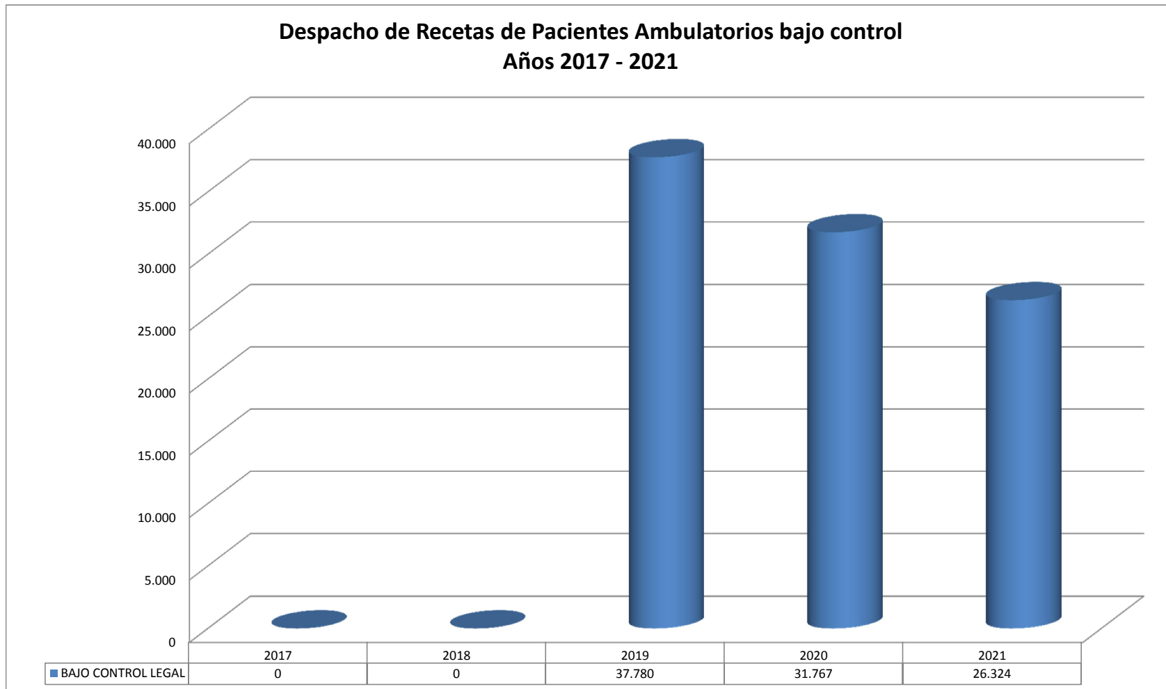
Despacho de Recetas de Pacientes Ambulatorios bajo control Años 2017 - 2021